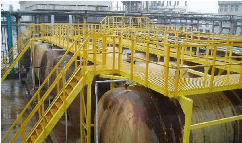
Figura 1 - Imagem de Referência de Tipo de Escada e Plataforma